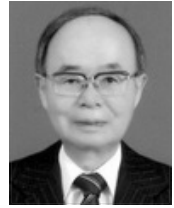
손재식 (전 통일부 장관)

여러분 반갑습니다. 오늘 매우 시의적절한 주제를 가지고 학술회의를 하게 된 것을 기쁘게 생각합니다. 우리의 간절한 소원은 한반도의 평화통일입니다. 한반도의 평화통일을 이룩하기 위해서는 무엇보다도 남한과 북한 간에 대화접촉을 하고 서로 협력해서 평화체제를 굳건히 구축하는 것이 필수적입니다. 그런 의미에서 남북정상회담이 시작되고 판문점선언 등을 통해서 이와 같은 취지의 합의가 이루어진 것을 매우 다행한 일이라고 생각합니다. 여기에는 북한의 핵무장에 대한 국제제재와 그에 더해서 우리 정부의 끈질긴 대화노력이 주효했던 것 같습니다. 그러나 오늘 아침에 여러분들이 다 뉴스를 통해서 들으셨습시다만, 미국이 미북정상회담을 6월12일에 싱가포르에서 하는 것을 취소한다는 발표를 했습니다. 저로서는 이런 일이 일어날 수도 있다고 생각했기 때문에 그렇게 놀라지 않았습시다. 그러나 결코 우리가 희망을 잃거나 또 좌절되거나 포기를 하는 일이 있어서는 안됩니다. 미북정상간의 대화의 여지는 아직 남아있다고 생각합니다. 아마도 합의상의 세부적인 문제에 대한 합의가 되지 않아서 그런게 아닌가 생각합니다. 물론 다른 요인도 있겠지만 그런 것이 중요한 요인이 아닌가 생각합니다. 그렇기 때문에 우리의 노력 여하에 따라서 우리가 기대했던 미북정상회담이 열려서 큰 발걸음을 던지게 되지 않을까 생각합니다. 백절불굴이라는 말이 있습니다. 마침 여기에 통일부위원 차관이 참석하고 있기 때문에 백절불굴이 아니라 천절불굴을 강조하고 싶습니다. 백번이 아니라 천번 난관에 봉착하더라도 또 장애물을 만나더라도 굴하지 아니하고 계속 줄기차게 대화노력, 평화노력, 통일노력을 해나가야 한다고 생각합니다. 트럼프대통령이 미북정상회담을 취소한 것은 여러 가지 원인이 있겠지만, 아마도 만족스럽지 않다고 생각해서 그런게 아닌가 생각합니다. 그전에 레이건대통령이 국회에서의 연설에서 그런 말을 한 일이 있습니다. no agreement better than bad agreement 즉, 나쁜 합의를 하기보다는 합의를 하지 않는 것이 좋다는 말입니다. 그런 취지에서 만족할만한 의견접근이 이루어질 때까지 미국이 이런 의도를 가진 것이 아닌가 하는 해석도 합니다. 여러분이 아시다시피 공신력이 없는, 또는 공신력이 약한 상대와 협상을 할 때는 냉철해야 되고 더 치밀해야 되고 더 신중해야 되고 또 확인에 확인을 해야 한다고 생각합니다. 그동안 북한의 행태라든가 속성을 볼 때 앞으로도 속일 수 있는 여지는 있다고 생