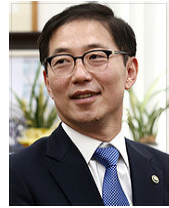
천 해 성 (통일부 차관)

먼저 오늘 학술회의가 개최된 것을 진심으로 축하드립니다. 존경하는 이흥구 총리님, 그리고 손재식 장관님, 한국통일협회의 구본태 회장님, 그리고 학술회의를 준비해 주신 모든 분들과 참여해주신 모든 분들에게 감사의 말씀을 드립니다. 평화의 길을 열어가는 일에는 지혜가 절실히 필요한 지금과 같은 시기에 한국통일협회가 첫 번째 학술회의를 통해 본격적인 행보를 시작하게 된 것을 매우 뜻 깊게 생각합니다. 지난 남북정상회담을 준비하면서, 이흥구 총리님과 원로자문단, 그리고 전문가 자문단에 계신 선배님들을 뵙고 도움이 되는 좋은 말씀을 많이 들었습니다. 이 자리에 계신 분들과 통일협회의 모든 회원님들께서도 남북정상회담이 성공을 거두어 한반도 평화의 문을 열어나가기를 그 누구보다도 뜨겁게 기원해 주셨을 것이라고 생각합니다. 언제나 든든하게 저희와 함께 해주시는 선배님께 깊이 감사드립니다. 한반도의 비핵화와 항구적 평화정착은 포기할 수도 그리고 미룰 수도 없는 역사적 과제입니다. 이에 우리와 국제사회는 6월12일 예정되는 북미정상회담의 성공을 기대하며 함께 노력해 왔습니다. 비록 북미정상회담이 예정대로 열리지 못하게 되었지만, 북한과 미국 모두 한반도 비핵화와 평화에 대한 기본입장은 변하지 않았다고 생각합니다. 양측 모두 대화의 중요성을 인식하고 대화를 통해 문제를 풀어갈 뜻이 있음을 여전히 분명히 밝히고 있습니다. 북한이 어제 우리와 국제사회의 언론인들이 지켜보는 가운데 풍계리 핵실험장 폐기를 진행한 것 또한 완전한 비핵화를 위한 의미 있는 조치라고 생각합니다. 북미양측이 보다 직접 적극적이고 긴밀한 대화를 통해 지금의 어려움을 해결해 나가기를 기대합니다. 우리 정부도 이를 돕기 위해 최선을 다할 것이며 핀문점선언의 이행에 또한 흔들림 없이 준비해 나갈 것입니다. 오늘 학술회의의 주제와 같이 평화를 향한 여정의 모든 순간에 올바른 방향으로 나아갈 수 있도록 이 자리에 계신 모든 분들께서 함께 힘과 지혜를 모아주실 것으로 믿습니다. 통일협회 가족 여러분! 우리는 과거의 교훈으로부터 미래를 열어나갈 지혜를 얻곤 합니다. 오늘 학술회의도 이번 판문점선언의 바탕이 된 남북기본합의서를 살펴봄으로써 남북관계의 지속가능한 발전방안을 모색해보는 의미 있는 시간이 될 것으로 생각합니다. 한국통일협회의 첫 번째 학술회의를 다시 한번 축하드리면서 함께 해주신 모든 분들의 건강과 행복을 기원드립니다. 감사합니다.